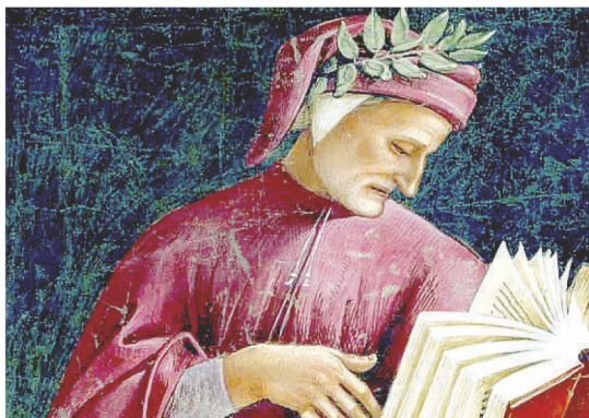
Dante Alighieri, affresco di Luca Signorelli (databile 1500-1504). Cappella di San Brizio nel Duomo di Orvieto.