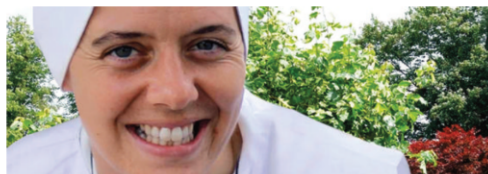
Suor Clare, sedotta da Cristo, voltò le spalle al mondo dello spettacolo. Oggi la sua storia testimonia a tutti che «vale la pena dare la vita a Dio».

Testi tratti dalla mostra I santi della porta accanto , promossa dall'Associazione don Zilli e dal Centro Culturale San Paolo. Per informazioni sulla mostra (ed eventuali richieste di esposizione): centroculturale.vicenza@stpauls.it , cell. 346 9633801.